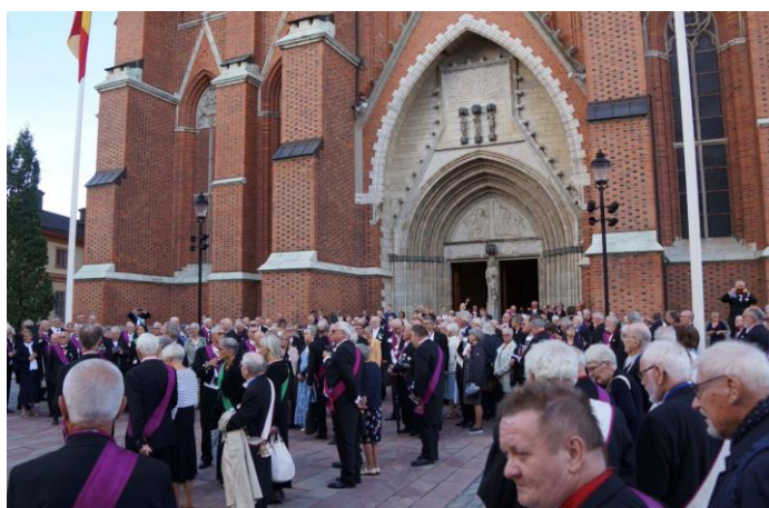
Lördag, en fullsatt Domkyrka i Uppsala