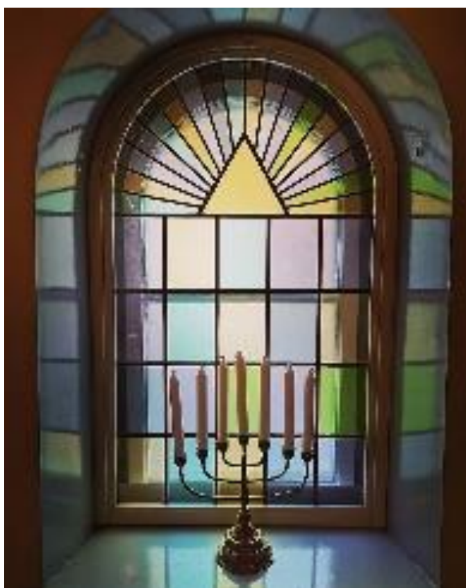
Strålar från vår ordensymbol vägleder oss. Liknande finns i Blåsbogården (vår gamla TR-lokal).

Låt oss därför bygga "kojor" innan det blir för sent, "kojor" av sanning, kärlek, renhet och trohet där vi kommer varandra så nära att vi kan viska i varandras öron budskapet från den store mästaren: "Vet du om att du är värdefull, att du är aktad här och nu, att du är älskad för din egen skull, att ingen annan är som du". Då kanske vi bättre klarar av vandringen på den ofta tönbeströdda vägen tills dess fullbordandets tolvslag klingar.