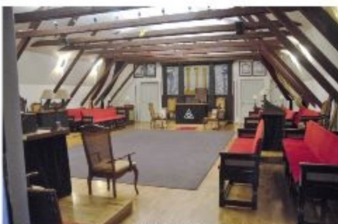
Nu finns vi i Odd Fellows lokaler på Åsgatan 45. Här ordenssalen.

Den 7 december är det prick 100 år sedan Riddaretempel Ariel bildades.