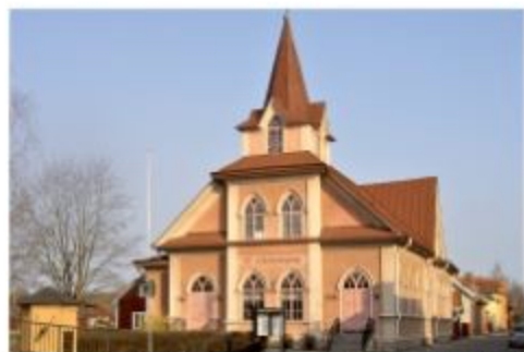
Vår första lokal låg i övre våningen på Johanneskyrkan i Falun.