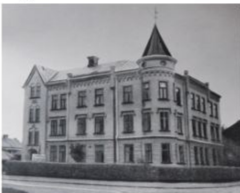
I 65 år var vår Ordenslokal inrymd i vår egen fastighet på Svärdsjögatan 8 i Falun.