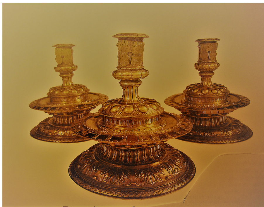
Förgyllt silver. Vikt ca 220 g/st. Höjd 19 cm. Diameter, fot 20 cm.

I vår domkyrka finns en "skattkammare" med en mängd föremål från kyrkans äldre tid. Här nedan ett par smakprov,