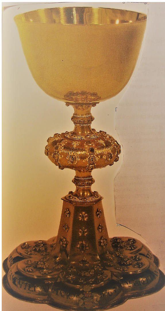
Höjd 22 cm. Diameter fot 15 cm, cuppa 11 cm. Vikt 229 g.

Hur dessa praktfulla ljusstakar kom i Magnus Brahes ägo vet vi inte, men när de skänktes till domkyrkan 1633 var de redan 80 år gamla. Kyrkligt silver har ofta bevarats, en glädjande följd av att kyrkorna i landet inte plundrats under de senare seklerna. Profant silver är mer ovanligt, eftersom det ofta smältes ner för att göras om i mer moderna former. Dessa ljusstakar är förnämliga arbeten från renässansen, lyxartiklar för de allra högsta samhällsskikten. De är helt täckta av antika ornament och utförda med hantverksskicklighet och känsla för proportioner. Möjligen rör det sig om de äldsta bevarade silverljusstakarna i Sverige. Inte heller i sitt ursprungsland har de några lika gamla bevarade motsvarigheter. Det ger dem en särställning inom guldsmidets historia.