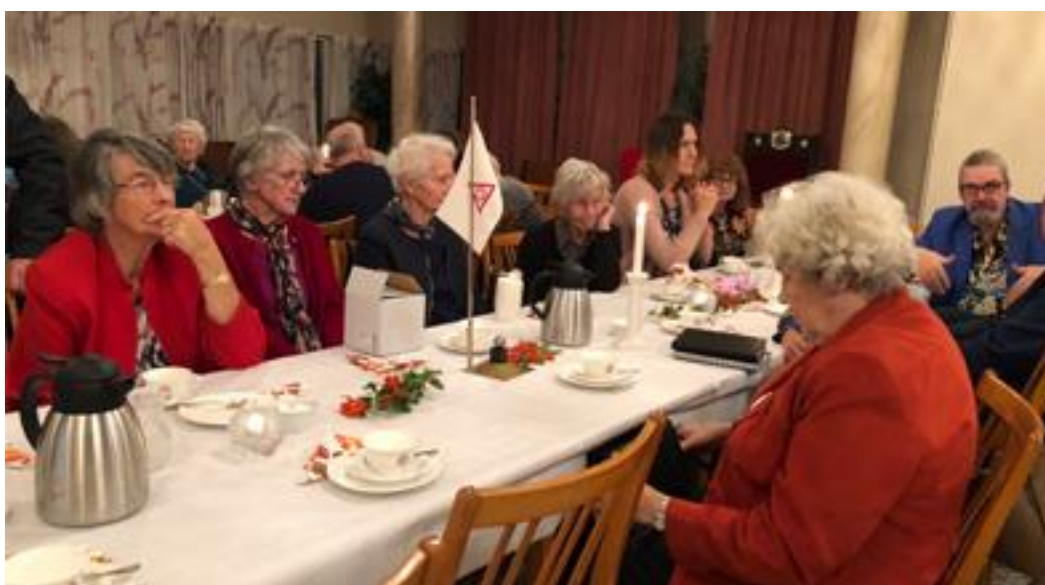
Damer och bröder vid kaffeborden.

Lotterier gjorde några deltagare (vinnarna) extra glada.