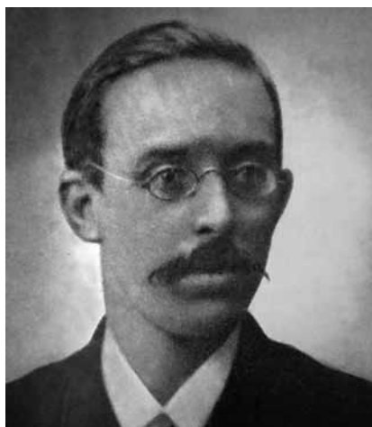
nadskåren i Jekaterineburg i Sibirien.