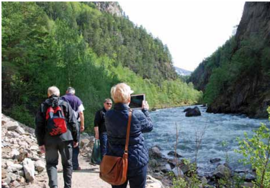
En promenad längs Junkerdalsälvenbjöd på en hänförande naturupplevelse.

Fredag morgon var det vandring till grillplatsen i vackert sommarväder längs den gamla vägen genom Junkerdalsura. En naturupplevelse av det större slaget med blommande