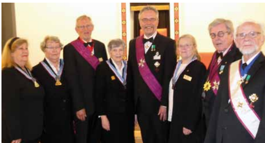
Officianterna vid det gemensamma högtidsmötet med TBO och TRO i Stockholm.