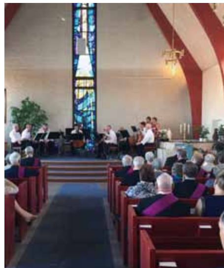
RT S:ta Gertrud firade sitt 90-årsjubileum i den vackra Marieborgskyrkan i Västervik.

Text: Leif Lundqvist