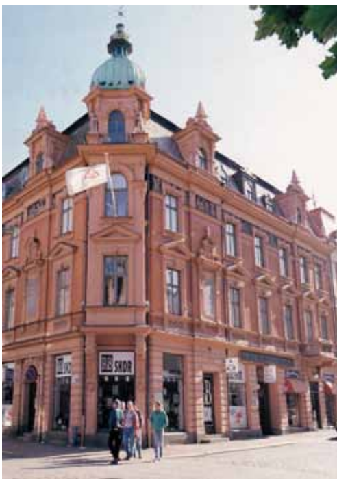
RT Hermes magnifika fastighet ligger mitt i staden och drar till sig blickarna.

Vilka egna fastigheter har Tempel Riddare Orden i Sverige? Och hur bär man sig åt för att finansiera dem? RT Hermes i Karlskrona äger ett av stadens vackraste hus.