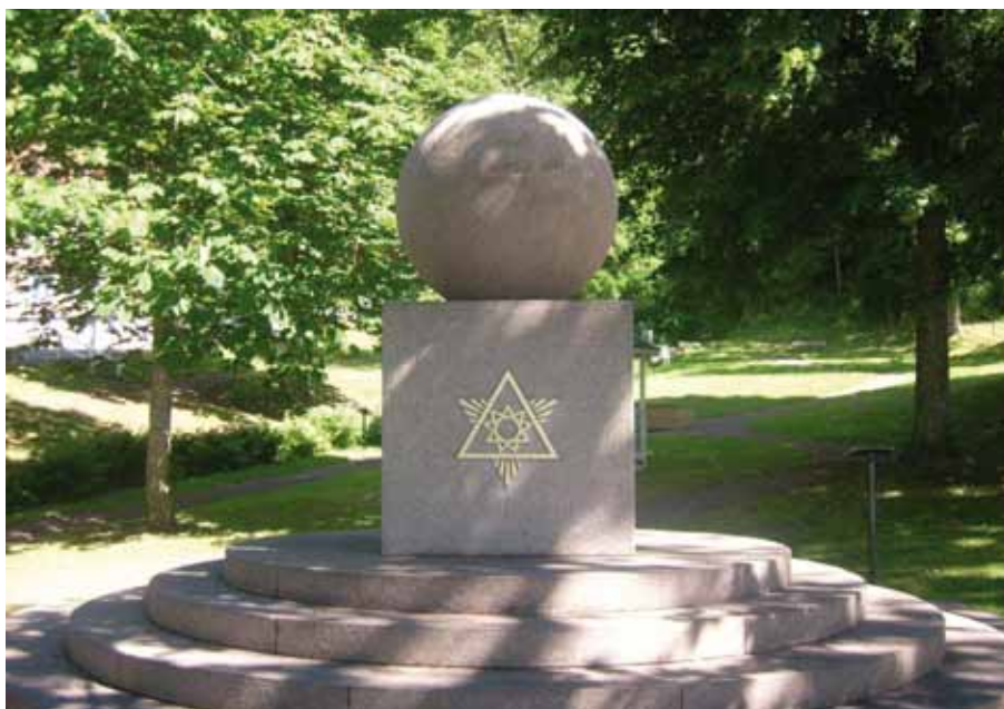
Ett monument avtäcktes i Gränna den 10 juli 1938 i samband med firandet av 50-årsminnet av Tempel Riddare Ordens införande i Sverige.

Amerika hägrade för denne yngling som vid det aktuella tillfället inte var äldre än 26 år. Han reste över till USA med sina föräldrar och hamnade på