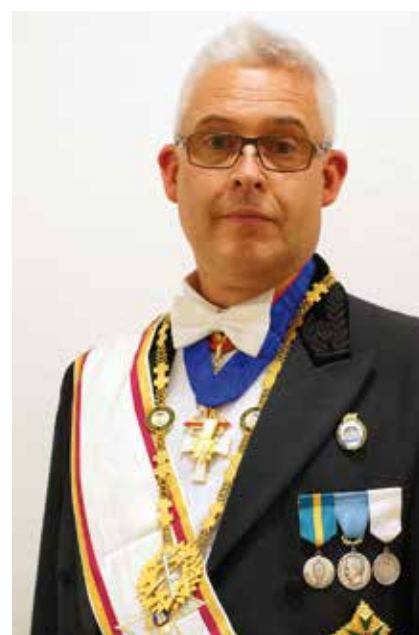
Mats Valli Stormästare

Projektet "Templet – Ordens kraftkälla" lever vidare, och ska köras igång i de Tempel som ännu inte startat. Att vi bättre lär känna vår orden och dess värdegrund samt höjer kvaliteten på vårt arbete bidrar till mer engagerade bröder. Och då blir det också lättare att vara aktiv i rekryteringsarbetet. Ställ dig själv frågan "Varför är jag Tempelriddare?" När du kan ge ett bra svar på den, då har du också goda förutsättningar att rekrytera!