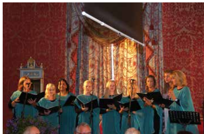
Ensemble du Nuovo bjöd på vacker sång vid många tillfällen under konventet.