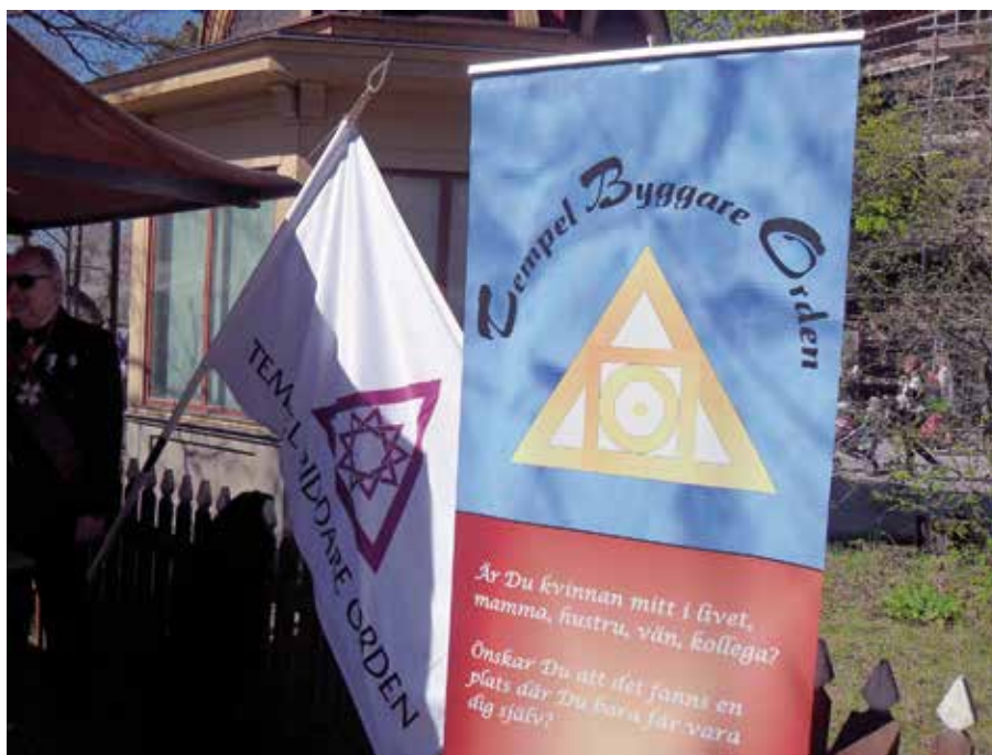
Den nyinköpta fanan och TBO:s roll up kompletterade varandra fint.

Från Tempel Riddare Orden och Tempel Byggare Orden, alltså RT Concordia och Mälardrottningen, var funktionärer på plats i vår monter och dessa marknadsförde våra båda ordnar med bravur. Material delades ut och samtal med intresserade tog vid. Totalt var fem funktionärer på plats.