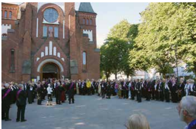
Högtidsgudstjänsten fick en mäktig avslutning när deltagarna samlades utanför kyrkan och tillsammans sjöng Härlig är jorden .