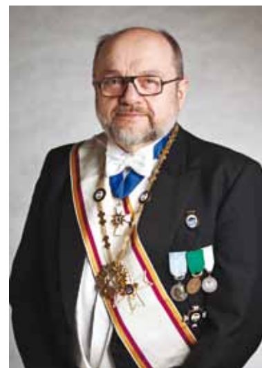
Per Fredheim SM