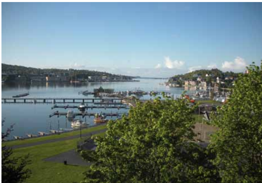
Vy från hotellfönster ut mot fjorden.

För många svenskar är nog Sandefjord en ganska anonym stad. Som turist har man kanske besökt Oslo eller Norges västkust. Såväl Ålesund som Trondheim har för övrigt haft General Konvent för inte så länge sedan (2004 respektive 1989). Mera sällan har turistresan gått till Vestfolds fylke, på Oslofjordens västra sida. Nu har vi en utmärkt möjlighet att ändra på detta. Här finns väl-