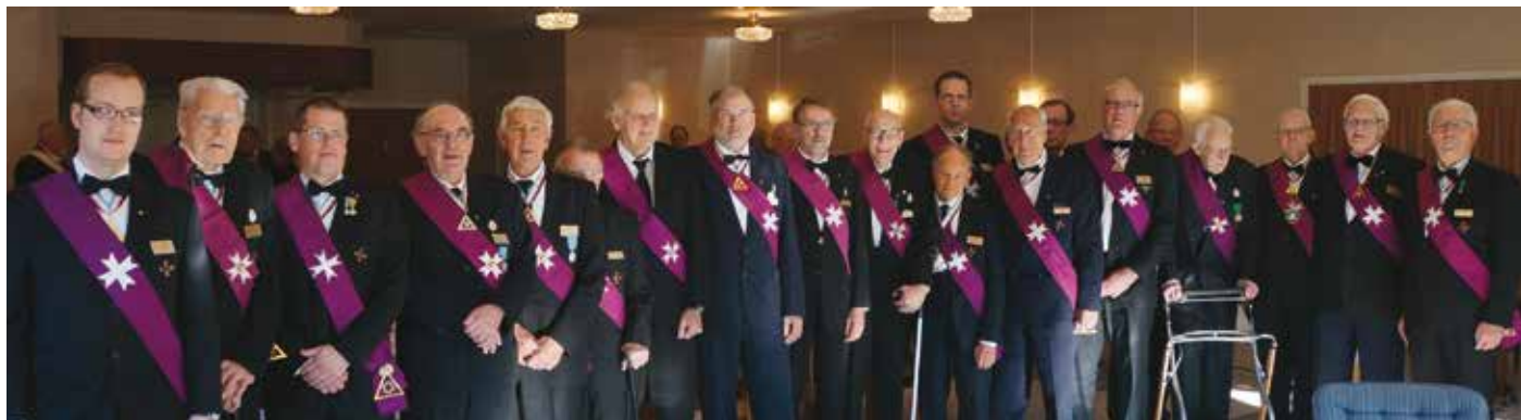
Inte mindre än 20 bröder från 10 tempel recipierade den 12 oktober i gradgivningsmötet i STICG i RT Wästmannias nyinvigda lokaler.