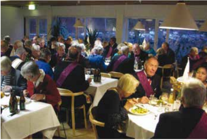
95 bröder och damer deltog i RT Minervas högtidliga jubileumsfirande på Södra Vätterbygdens folkhögskola.