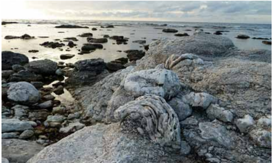
En vy från en av Gotlands många säregna stränder.

Vi vill också visa upp ett somrigt och vackert Gotland med vår medeltida stad, Visby. På Konventets hemsida kommer att läggas ut bilder och filmer som presenterar vår ö.