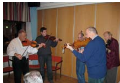
Malmö Spelmanslag i aktion.

Den 4 December 2008 firade Damsällskapet i Malmö 95 års jubileum.