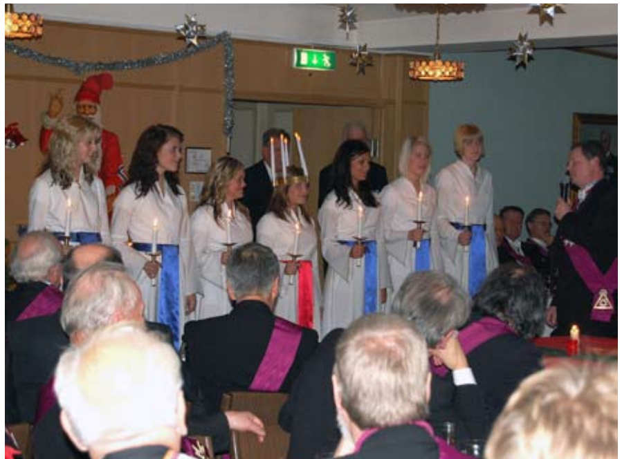
M i RT Veritas tackar Sjuhäradsbygdens Lucia med tärnor genom att överlämna en penninggåva.