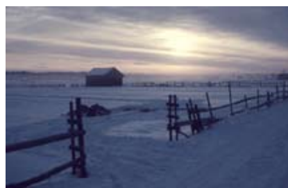
"Kall morgon i Södra Grundfjorden"